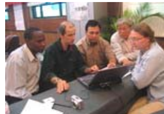
Kegiatan kelompok menuju statemen visi dan misi, Yichang

Hanspeter Liniger , WOCAT Programme, Berne University, Switzerland. hanspeter.liniger@cde.unibe.ch