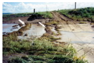
Pagar vetiver ditanam pada upstream dan dekat crossing, hasilnya adalah kecepatan banjir tidak dapat memotong crossing tersebut (pada banjir terdahulu, tanpa vetiver crossing telah dirusak dan harus dibangun kembali).

(iii) Pengurangan kecepatan run off – studi di Amerika dan Australia menunjukkan bahwa barisan vetiver efektif untuk mengurangi arus kedalaman dan kecepatan dari arus air. Efektivitas pagar vetiver meningkat seiring dengan ketebalan (dewasa). Pagar rumput dewasa terbukti sangat efektif untuk mengurangi kecepatan aliran run off dibawah 20 cm, cukup efektif untuk mengurangi aliran antara 35-40 cm dan memiliki beberapa dampak untuk mengurangi aliran antara 60-80 cm.