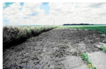
Pagar vetiver memiliki kemampuan menangkap sedimen dan limbah lainnya pada kondisi banjir. Darling Downs, Australia.

75Mpa) meningkatkan secara nyata kekuatan gesek tanah (sebesar 40%). Vetiver memiliki kelebihan dengan ringannya biomassa dan rendahnya profil angin, sehingga dapat mencegah masalah-masalah yang terkait dengan stres yang besar pada lereng-lereng yang tidak stabil.