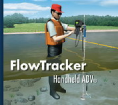
FlowTracker Handheld ADV®