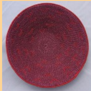
Swazi Basket #548