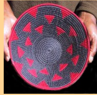
Swazi Basket #539