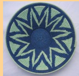
Swazi Basket #556