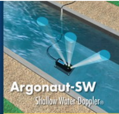
Argonaut-SW Shallow Water Doppler®