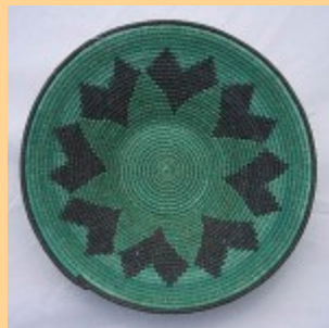
Swazi Basket #555