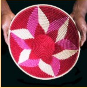
Swazi Basket #537