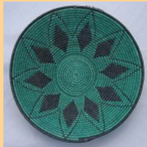
Swazi Basket #552