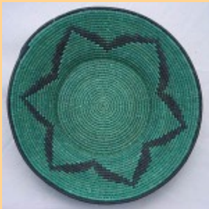
Swazi Basket #551