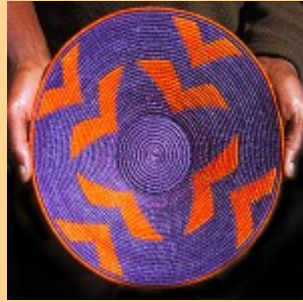
Swazi Basket #541