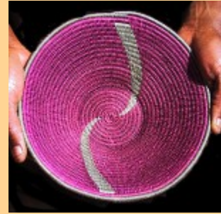
Swazi Basket #542