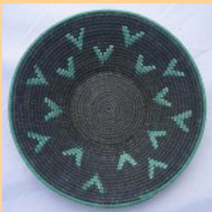
Swazi Basket #554