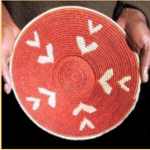
Swazi Basket #540