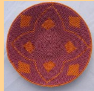
Swazi Basket #549