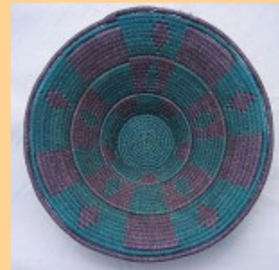
Swazi Basket #553