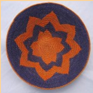
Swazi Basket #547